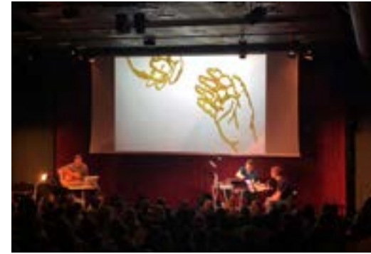
Litteraturhuset i Oslo.