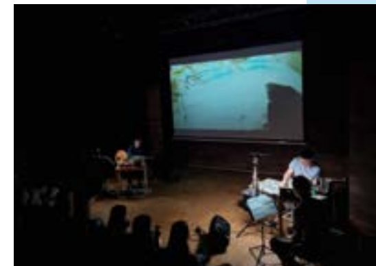
Litteraturhuset i Bergen.

Forestillingen ble spilt for ungdomstrinnet og videregående skoler våren 2022 på Litteraturhuset i Bergen, Litteraturhuset i Oslo, i Maihaugsalen under Litteraturfestivalen på Lillehammer, på Oppdal bibliotek, Trondheim bibliotek og i Tøyenparken under Kulturfest Oslo.