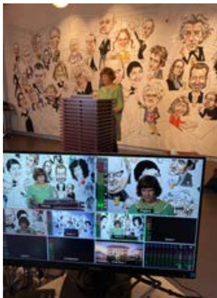
Digitalt kurs om ord og bilde

LSB har opprettet en digital og uformell møteplass for bibliotek i nettverket og andre interesserte: Kaffeprat. Hver siste fredag i måneden inviterer vi til digital samling med et nytt tema. Tema har vært knyttet til alt fra konkrete boktitler, til formidlingsprosjekt som «Boksøk for ungdom» eller «Bærekraftsbiblioteket». Eksterne har også blitt invitert til å bidra. Opptaket av møtene er tilgjengelig for alle på våre nettsider. Kaffepratene med teamet «Digital språkkafe» er opptaket som er sett flest ganger i etterkant, med 200 avspillinger.