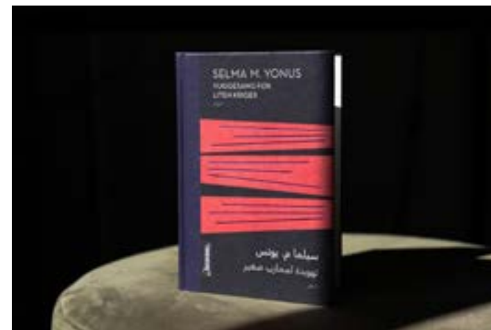
"Vuggesang for liten kriger" av Selma M. Yonus